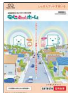
しんきんグッドすまいる (個人用火災総合保険)