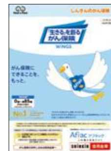
「生きる」を創るがん保険 WINGS (がん保険)