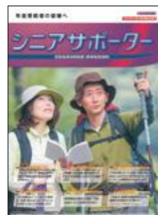
しんきんシニアサポーター (標準傷害保険)