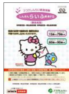
しんきんらいふ終身FS (フコクしんらい終身保険) ©2024 SANRIO CO., LTD. APPROVAL NO. L851837