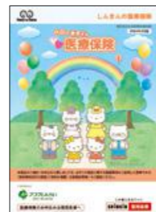
ハローキティの医療保険 (医療保険)