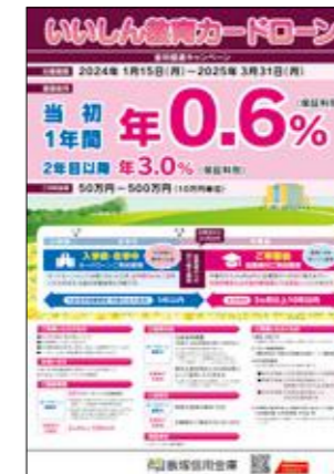
教育カードローン