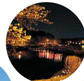
いづか桜灯 in 鳥羽公園