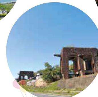
三菱飯塚炭鉢 巻き上げ機台座