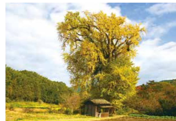
内野宿の大イチョウ