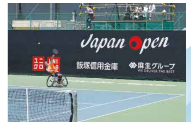
車いすテニス大会