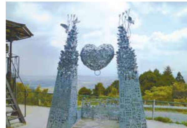
八木山展望台しあわせの鐘

これからも地域金融機関としての社会的使命を果たし、「飯塚信用金庫」ならではの独自性の発揮と健全経営に徹し、地元の皆さまに信頼され親しまれる信用金庫として、その使命を全うすべく役職員一同全力を傾注してまいります所存でございます。どうか変わらぬご支援とご協力を賜りますようお願いいたします。