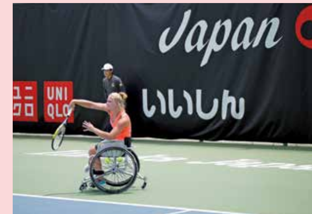
飯塚国際車いすテニス大会

これまでの、お客さま、会員、地域の皆さま方へ「感謝」とともに、これからの100周年へ向かって皆さまとともに成長、発展を目指します。