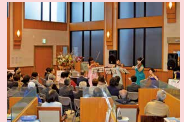
ロビーコンサート