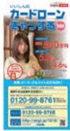
信金 信託信用金庫