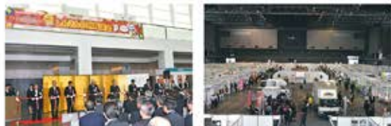
『第4回しんきん合同商談会』を平成29年10月に予定しています。