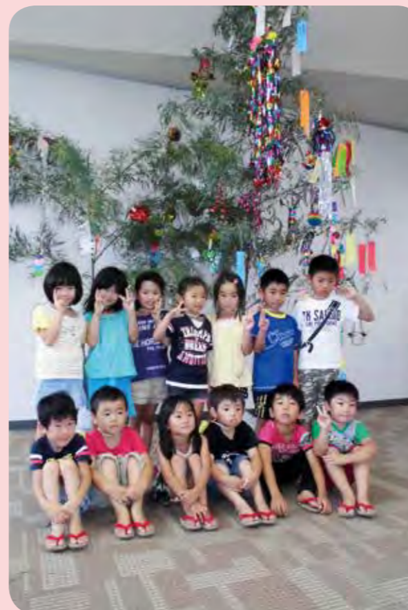
七夕飾り「鯉田保育園」園児の皆さん(2015.7.3)

これまでの、お客さま、会員、地域の皆さま方へ「感謝」するとともに、これからの100周年へ向かって皆さまとともに成長、発展を目指します。